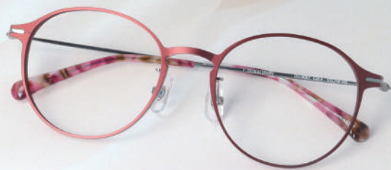
DU-8007 Col.4 WN

シャープなカットはコンピューター制御の最先端技術から生まれます。 細身な中にも変化を可能にし、より質感を高めます。