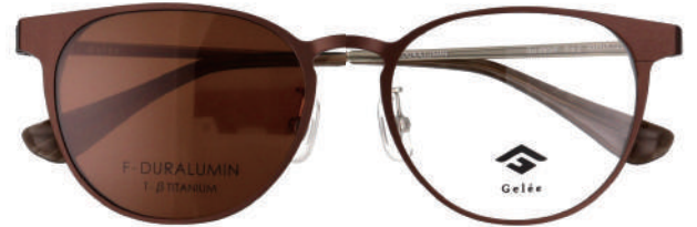
Col.2 BR BROWN LENS VLT:13.3%