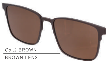
Col.2 BROWN BROWN LENS VLT:13.3%