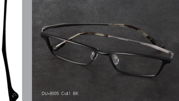
DU-8005 Col.1 BK