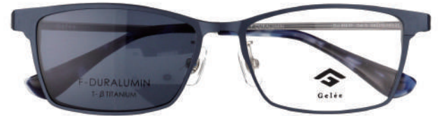
Col.3 DNV BLUE LENS VLT:15.9%