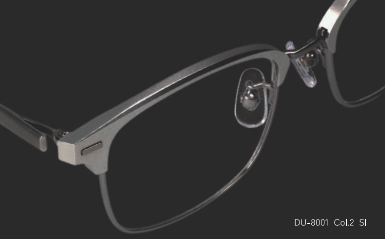
DU-8001 Col.2 SI