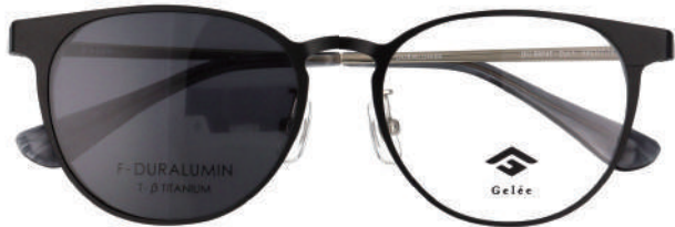
Col.1 BK SMOKE LENS VLT:11.6%

2ポジションで保持が可能なマグネット式クリップオン。フレーム上に装着すれば暗所でケースに収納する煩わしさがありません。