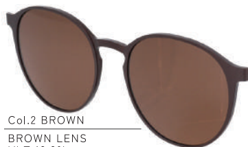
Col.2 BROWN BROWN LENS VLT:13.3%