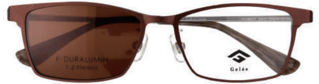
Col.2 DBR BROWN LENS VLT:13.3%