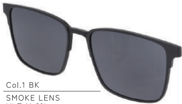
Col.1 BK SMOKE LENS VLT:11.6%