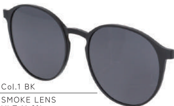
Col.1 BK SMOKE LENS VLT:11.6%