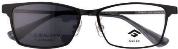
Col.1 BK SMOKE LENS VLT:11.6%

2ポジションで保持が可能なマグネット式クリップオン。フレーム上に装着すれば暗所でケースに収納する煩わしさがありません。