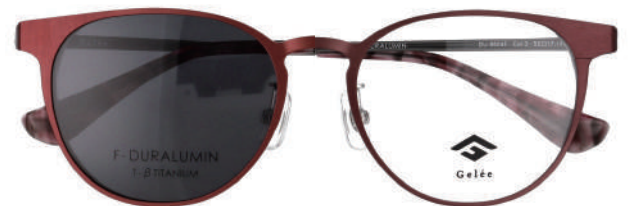
Col.3 WN SMOKE LENS VLT:11.6%